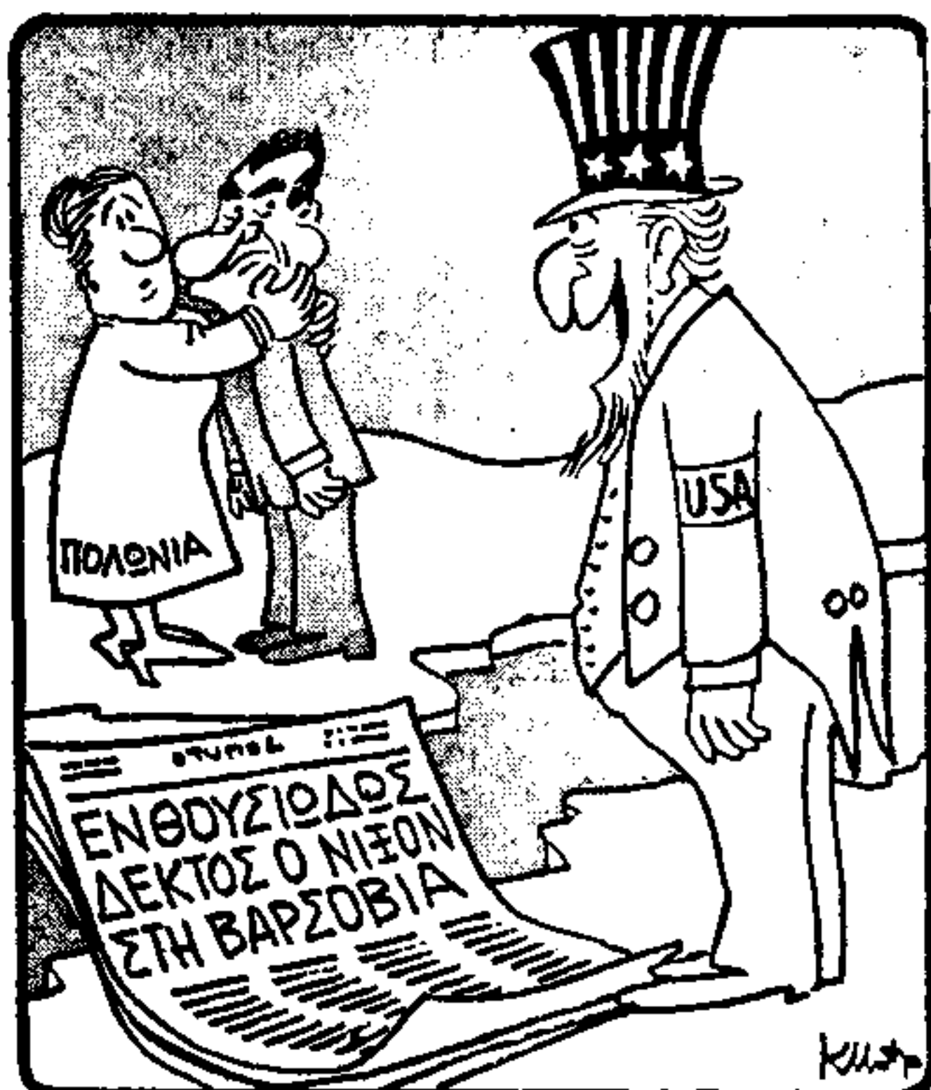
— Σας άρεσει πολύ να μιλάτε; Κρατήστε τον... (Τού Κόσμου Μηνόμοιλο)