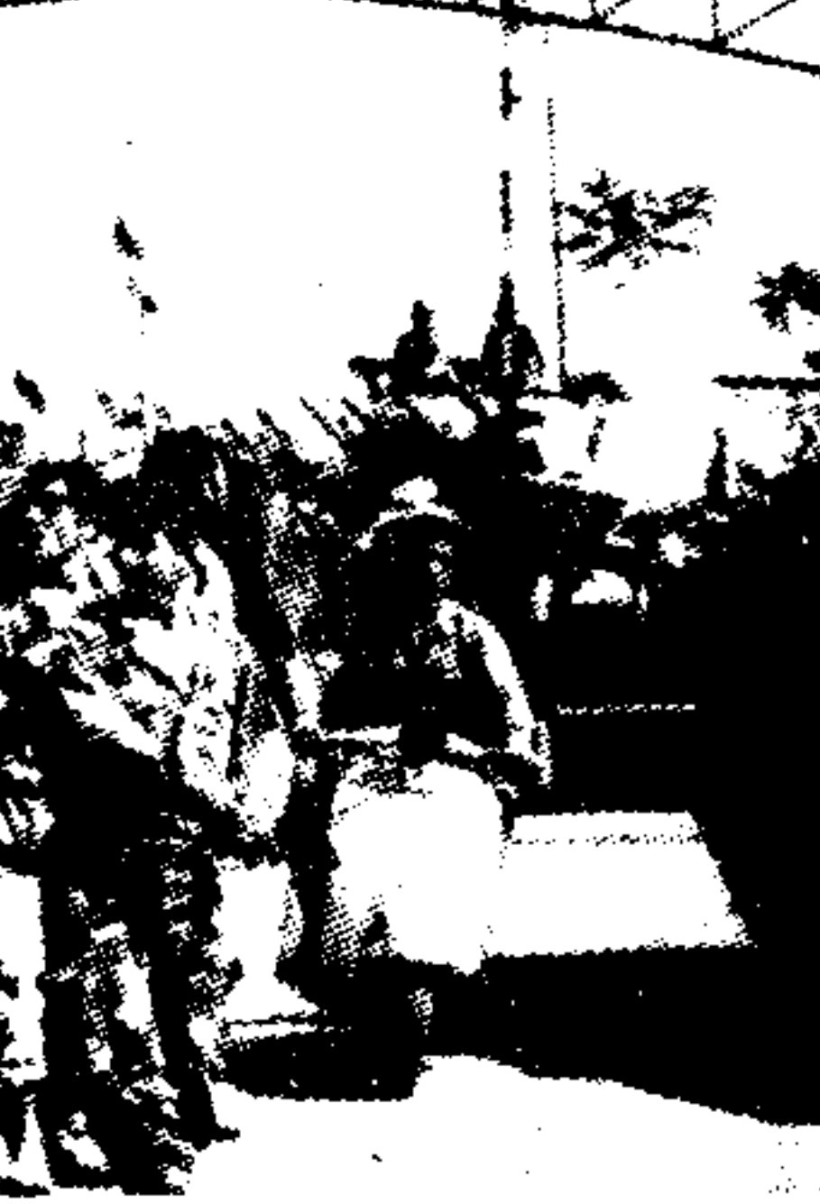
Άρματα μάχης του Ισραήλ περιπολούν στην Γερουσαλήμ...