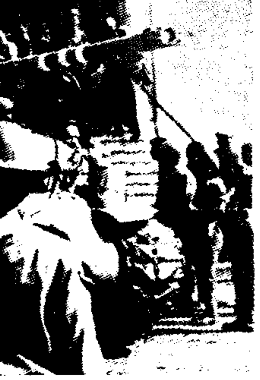
Άρματα μάχης του Ισραήλ περιπολούν στην Γερουσαλήμ...