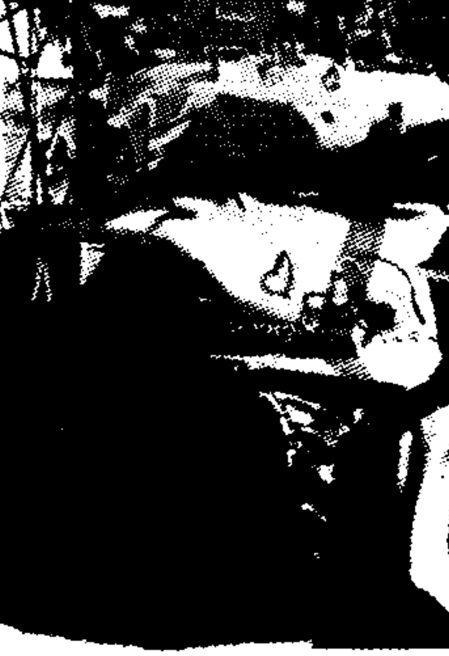
Άρματα μάχης του Ισραήλ περιπολούν στην Γερουσαλήμ...